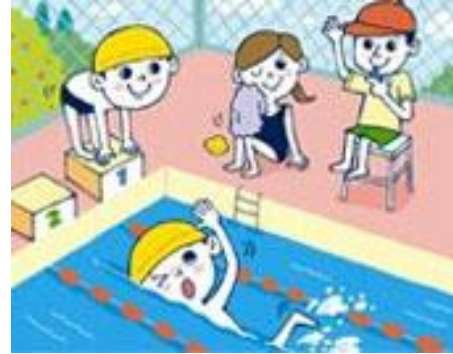
In piscina ci divertiamo sempre tanto!

A mezzogiorno siamo tornati a casa un poco stanchi ma tanto soddisfatti e contenti.